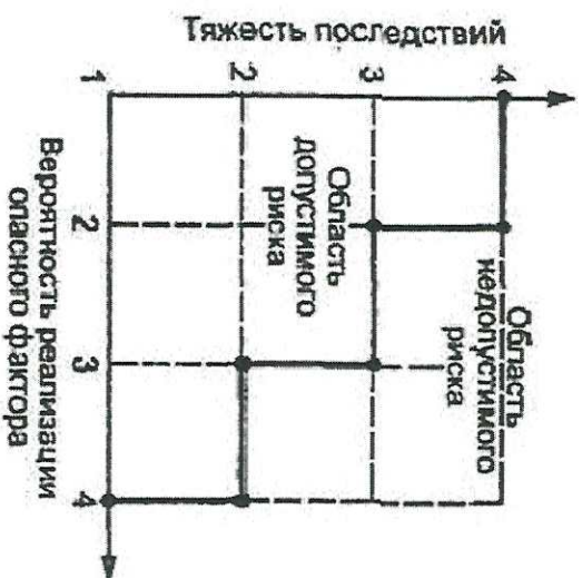
Таблица анализов риска при приготовлении и потреблении блюд.